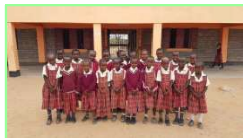
P+7 Einschulungsjahrgang 2019

Seit 2017 finanzieren wir über Patenschaften den Schulbesuch für Kinder, deren Eltern auf Genitalverstümmelung und Zwangsverheiratung verzichten. Im September-Newsletter haben wir Sie gebeten, eine solche Patenschaft für den Jahrgang 2020 zu übernehmen.