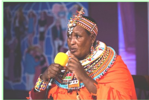
Vortrag im Frauenmuseum Bonn

Rebecca konnte spannend und authentisch über die Transformation im Leben der Frauen und Kinder von Umoja berichten, die durch die Hilfe aus Deutschland ermöglicht wird.